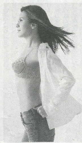
125周年戦略商品として発売した「凛々ブラ」

体では震災の影響で前年を越えたが、4月以降は前年を越え、6月後半からは2ケタで推移。下期はインタシヨナル創業125周年のブランドの発売が相次いでいる。今、今の勢いを維持する。